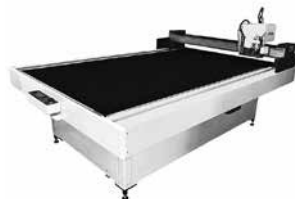
ASシリーズ AS2013F (3軸仕様)

速く、美しく、効率的に加工できるACSのマルチカッティングマシン。従来のサンプルカットの次元を超えた高速・高精度、ツールを自在に組み合わせられる高い拡張性で、すぐれた生産性を発揮するハイエンドマシンをご提案致します。近年需要が高まる小ロット・多品種の要求対応にお応え致します。