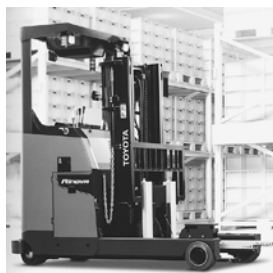
自動運転タイプフォークリフト「RinovaAGF」

トヨタL&Fは多様化する物流改善ニーズを、お客様とともに解決するベストパートナーです。物流現場において近年高まる自動化・無人化需要に合わせ、スマート物流ソリューションの展開に力を入れています。今回は搭乗兼用型自動運転タイプフォークリフト「RinovaAGF」の実演走行のほか、搬送現場を手軽にカイゼンできるシンプルAGV「キーカート」を展示いたします。