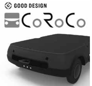
協働運搬ロボット CoRoCo

協働運搬ロボットCoRoCoを活用した運搬作業のソリューションをご提案しております。弊社で開発・生産している運搬現場改善のための新発想の運搬ロボットで、コストをかけず重量物運搬などの作業負担を軽減し、労働環境を改善。作業効率化と生産性向上も実現します。当日は体験デモや、被災地等における不整地での運搬作業改善・安全性向上のご提案も。(URL: https://seeds-robotics.jp/ )