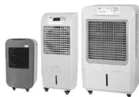
気化式冷風機です。サイズ展開あり。

水の気化熱を利用して、廃熱なしで冷風を出すことが出来ます。スポットクーラーと比べて消費電力が少なく、節電・節約に繋がります。自然な風ですので、体が冷えすぎてしまう心配もありません。サーキュレーター代わりにもご使用いただけますので、自治体によっては補助金制度の対象となります。地球にも身体にも優しい風を、ぜひ一度ご体感ください。お待ちしております。