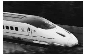
800系 九州新幹線つばめ

JR九州では九州新幹線を利用した荷物輸送サービス「はやっ!便」を博多駅～鹿児島中央駅間でスタートしており、熊本駅～博多駅間でも事業を開始する予定です。熊本駅から荷物を新幹線に乗せ、博多駅まで新幹線で即日お届けします。駅のみどりの窓口に荷物をお持ちいただき、手続きはほんの数分で終了、博多駅まで最速で50分!ちょっとした荷物や店舗間での物品移動、また社内での大事な書類など、急いで送りたい!というときにぜひ活用ください。