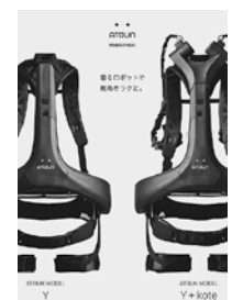
ATOUN MODEL Y ATOUN MODEL Y+kote

ATOUNは作業者の腰と腕と身体の負担が軽減できる装着型ロボットです。特に中腰作業時に効果を発揮します。身体を起こそうとした時に自分の体と荷物をアシストしてくれます。自動でモードが切り替わるのでストレスなく作業ができます。