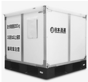
梱包費用削減 余分な資材が不要

当社ブースでは、お客様の様々な課題を解決するサービス・ソリューションを幅広く紹介いたします。2024年労務管理厳格化によるトラック不足や、将来の運転手不足への布石として、輸送の複線化で内航船輸送、鉄道コンテナ輸送をご提案します。また、当社オリジナルの輸送容器を使用頂くことで「リユース」「リデュース」「リサイクル」等、環境配慮型の物流を実現します。