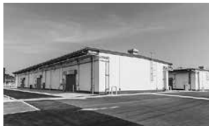
南九州唯一の営業用危険物倉庫 絶賛稼働中!!!

熊本地震発生時にも大切なお客様の商品に全くダメージはなく、安全性・耐震性が実証されました。BCPの観点からの保管場所の分散や熊本県最大の国際貿易港“八代港”を活用した輸出入の最前線の拠点としてのご利用など、多様化するお客様のニーズとウォンツに柔軟かつ的確に対応いたします。南九州唯一の営業用危険物倉庫として、また、九州一円をカバーする物流拠点として、皆様のご利用をお待ちいたしております。