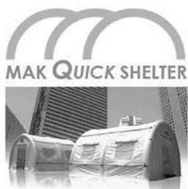
1分で設置 [マク・クイックシェルター]

太陽工業株式会社は膜技術を応用して災害時に起こる課題を解決します。薄く柔らかく軽量な膜ですが、高い強度と無限の用途をもち、提供できる製品群は仮設テント、救援物資受入れの為に荷捌き場、資材仮置きシート、運搬用資機材、土木資材など多岐に渡ります。避難所内部においても膜材を用いて空間を仕切る事で、プライバシーの保護、ウィルスの遮蔽、空間の用途の明示、保温・保冷といった様々な事が可能です。