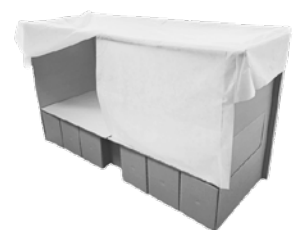
プライバシーを保護し、飛沫感染も防ぎます

3ステップで組み立て簡単、パーテーションがプライバシーを保護し、飛沫感染を防ぎます。ベッドとパーテーションが一体化しているため、パーテーションが倒れたり、床板がずれて転落するなどのリスクが軽減されます。阪神・淡路大震災を経験し、災害発達の初期の段階でいち早く避難場所の設営ができ、混乱した状況で少しでも快適に過ごすことができたなら...という思いから、「ひらいてボン」は誕生しました。