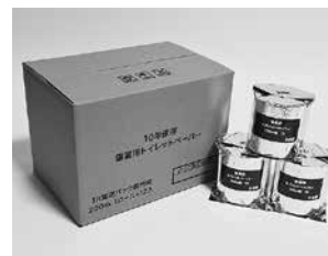
アルミ蒸着包装で衛生的です。

高知県で唯一の再生紙メーカーです。製品は10年のメーカー保証付きで安心備蓄用200m巻トイレトーパーです。真空パック包装により長期保存を可能にし、浸水試験もクリアしており安心して備蓄していただけます。また1人1週間用備蓄トイレトーパーもラインナップに加え、コロナウィルスなどの感染症に配慮した備蓄専用トイレトーパーもご覧いただければと思います。