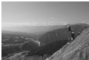
阿蘇大橋地区斜面対策工事の様子

足場を組めない、重機の入らない、そんな現場条件でもロックボルトの施工ができるスタンドドライブ(SD)工法の展示を行います。阿蘇大橋地区斜面対策工事にも採用され、約8500本を施工しました。高い汎用性とコスト工期縮減が可能なSD工法ブースに是非おこしください。