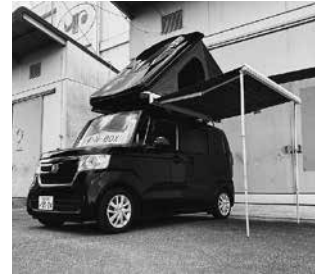
ルーフテントを取付けたホンダ・Nbox

日常生活で普通に使える軽キャンピングカーOKワゴンは、ソーラーパネル、サブバッテリー、ベッドなど備えており災害時にも活躍します。また、愛車に工具不要で簡単にセット出来るベッドキット、2段ベッドキットがあればエコノミー症候群の心配もありません。愛車の屋根にセット出来るルーフテント、サイドウォールなども展示します。今回デモカーを展示しますので、実際に横になったり体感してください。