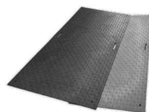
養生用樹脂製敷板「Wボード」

普段なかなか触ることが出来ない樹脂板・合成ゴムマットの現物をお持ちいたします。ブースにお見え頂ければ実際に手に取り触って頂き軽くて丈夫な樹脂板をご体感頂ければと思います。従来では敷鉄板が主に使われていますが、持ち運びに不便な点や施工時などに起こる事故など絶えません。そういった問題の解決に繋がる製品になっております。ぜひお気軽にお問合せください。