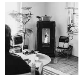
ペレットストーブとポータブル電源

独自の蓄電システム「なんちゃってオフグリッド®」を活用することで、蓄電システムをメインに使用し、不足分だけ電気を買うことができるため、値上がりする電気代の節約だけでなく環境や防災にも大きなメリットを生むことができます。「防災×環境×暮らし」をテーマに「オフグリッド住宅」や「エネルギーリノベーション」をはじめ、「ポータブル電源」や「ペレットストーブ」等、様々な角度から再エネの利活用に取り組んでいます。