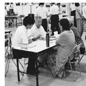
宅地の相談に真剣に対応する地盤品質判定士

地盤品質判定士会では、住宅及び宅地の防災及び国民の安全に貢献するため、市民向けの相談会やセミナーなどの開催、地盤災害などに関する住民支援などの活動を実施してきております。また、近年の住宅災害、地震災害、土砂崩れ災害などのリスクの高まりから、住民支援やフォローアップ支援にも対応しております。会期中は、ブースに地盤品質判定士が待機しておりますので、宅地の相談等にお気軽にお訪ねください。