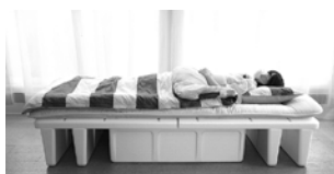
簡易組立ベッド「床にボン!」

自動車の機能材として用いられている素材、発泡ポリプロピレンで業界初となる組立式ベッド「床にボン!」を開発しました。工具いらずで組立時間約1分・約5kgの軽量・アルコール消毒可能で繰り返し使用ができるベッドとして、主に災害時における自治体の避難所に採用されています。展示会では実物サンプルを是非ご覧いただけます様、お願い申し上げます。