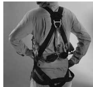
フルハーネス型墜落制止用器具

2019年2月に改正された労働安全衛生法施行令により、高所作業において長年使用されてきた安全帯から「墜落制止用器具」に変わりました。墜落制止用器具として認められているフルハーネス型・胴ベルト型を多数展示しております。