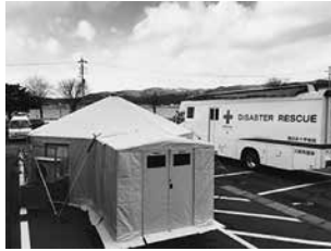
ゲートキーパー20シェルターシステム

ウエスタンシェルターは航空機に使われるアルミを骨組みに使用、迅速に組み立てられるシステムです。シェルター同士を接続することで災害対策本部や仮設救護所、救助者の居住区など多様な使い方が可能です。豊富なオプションで手術室や集中治療室など、さらに快適な空間をご提供いたします。