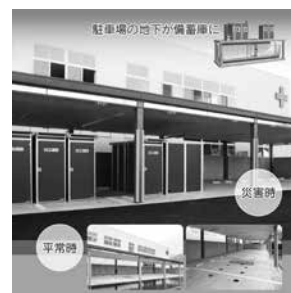
日赤高知県血液センター

大規模災害時に備え、組立式簡易水洗トイレ10基と災害時必需品を地下槽内へ備蓄。災害時には被災者自らがトイレを設置でき、直ぐに使用可能です。トイレは500人が30日間使用可能であり、災害用トイレとしては断トツの処理量!学校や保育所など地域の避難所となる場所にオススメです。平常時は駐車場など有効活用できます。 納入実績: 25基 (高知県内23基/愛知県2基) 令和3年10月現在