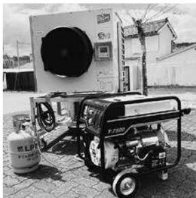
安心・安全な日本製 「スポットバズーカ」

災害時に避難所となる施設へエアコン導入を考えてみませんか? 公立小・中学校への体育館導入実績は400校以上! 調整可能な「冷風と湿度」。WBGT軽減へ導きます! 避難所の備蓄整備に掲げられるエアコン+移動式小形発電機 (LPガス&ガンリン) とのカップリングもご提案致します。