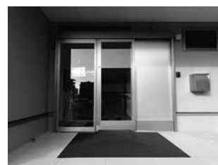
防災対策 熊本公明党本部 防災自動ドア

電気を使わない自動ドアは災害時の停電の影響を受けないため閉じ込め状態を防ぎます。駆け込みや挟まれ事故防止策として高い安全性と手を触れずに開閉できることにより感染症対策にも有効です。公共施設や高速道路に順次導入していただいております。現在建設中の熊本県防災センターにも採用されております。実際のデモ機を設置いたしますのでこの機会に多くの方に体験していただき、地域防災力向上に繋げていけたら幸いです。